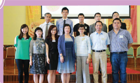
第十六屆家教會委員合照