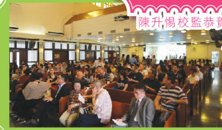
衷心多謝家長出席