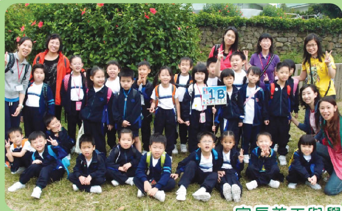
家長義工與學生共享郊遊樂趣！