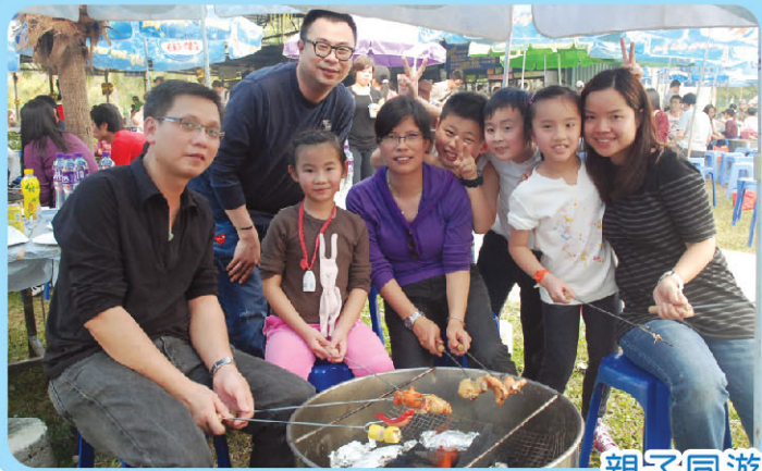
親子同遊，樂也融融！