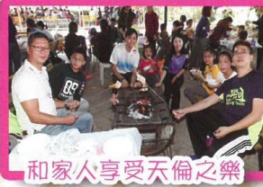
和家人享受天倫之樂