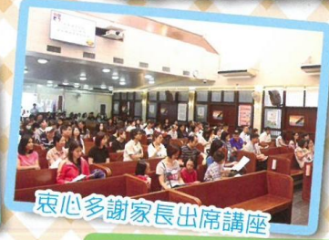
衷心多謝家長出席講座