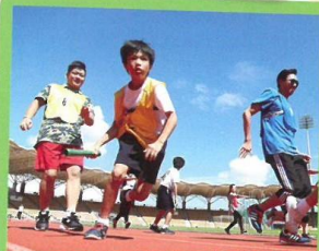
爸爸媽媽，我會努力向前衝