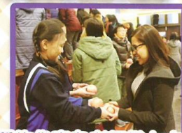
學生代表向老師獻上水果