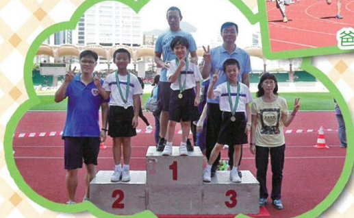
哈哈！我們實至名歸