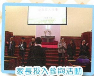
家長投入參與活動