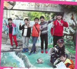
我們玩得很開心啊