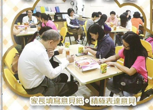
家長填寫意見紙，積極表達意見