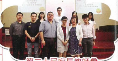
第三十屆家長教師會常務委員合照