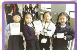
我們要送敬師卡給老師