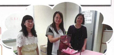
家長校董投票情況

五年時間過得很快，不斷看着女兒的改變，家教會也不斷優化及更新。今年舉辦了茶聚和增設不同的交流群組，希望能有效促進家校溝通和合作。最後，本人期盼明年有更多家長加入委員會，一起建設一個滿有「愛」的校園給我們子女成長。