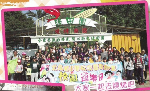
大家一起去燒烤吧