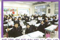
感謝老師的悉心栽培