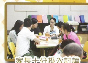
家長十分投入討論