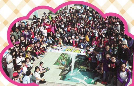
家長教師會 親子旅行大合照