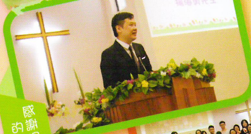
感謝場先生的分享