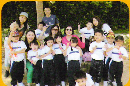
看我們多愉快的臉