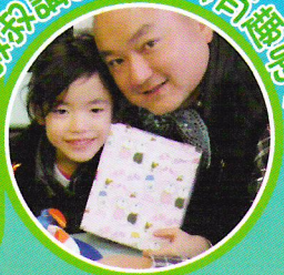
叔叔講的故事真有趣啊！

參與故事媽媽叔叔這活動，讓外子和我一窺孩子在課室裏與其他同學互動時所展現的另一面，更珍貴的是故事主題貼近孩子的興趣，回家後還會跟我們「回顧」劇情，重要的信息在不知不覺中植根孩子的心田。感謝各位老師及家長們的付出，孩子接過禮物，或許會樂上一天，但從故事所得著的道理，卻受用一生，所以故事媽媽叔叔是一個能充份發揮家校合作又具有意義的活動。