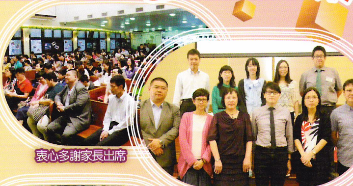
衷心多謝家長出席