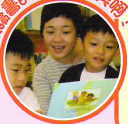
媽媽讀書的聲線真甜美啊！

最後，多謝北循學校校長及老師們，花了不少心思去設計各式各樣的活動給家長們參與，令家校合作的理念得到好的成效！