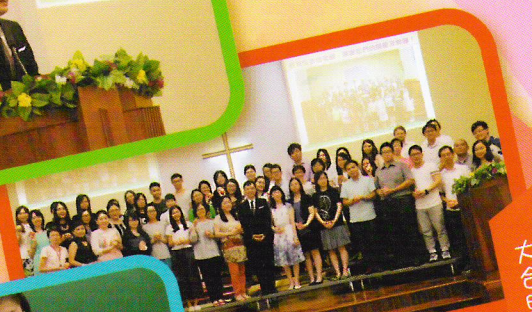
敬師日老師大合照